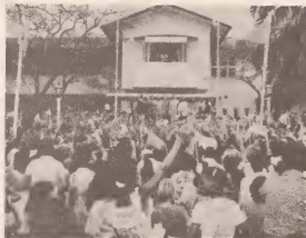
Grandioso aubade di muchanan di school ariba 18 di Maart 1978.